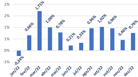
Varição da Cota Previdenciária